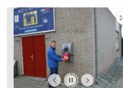
(1/2) AED HC Catwyck