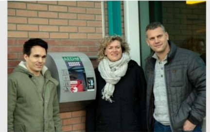
De wethouder (midden) en de initiatiefnemers bij een AED.